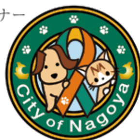
ワンニャンサポート エンブレム